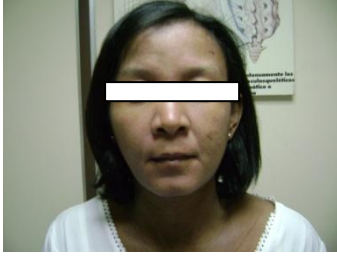
Figura 2. Acentuación de los surcos radiales.