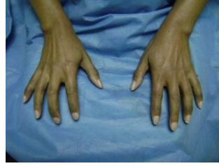
Figura 3. Raynaud 2 fases